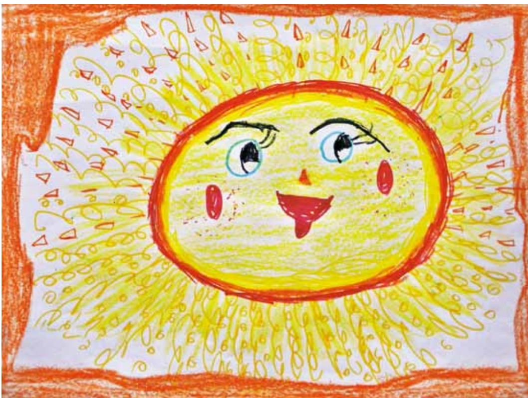
Владислава Първанова, 6 години ЦДГ No 2 "Юнско въстание", гр. Плевен