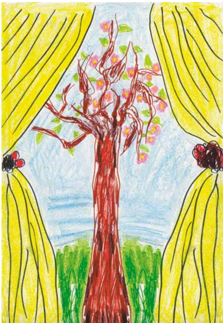
Далия Лука Спасова, 6 години ЦДГ "Здравец", гр. Велико Търново