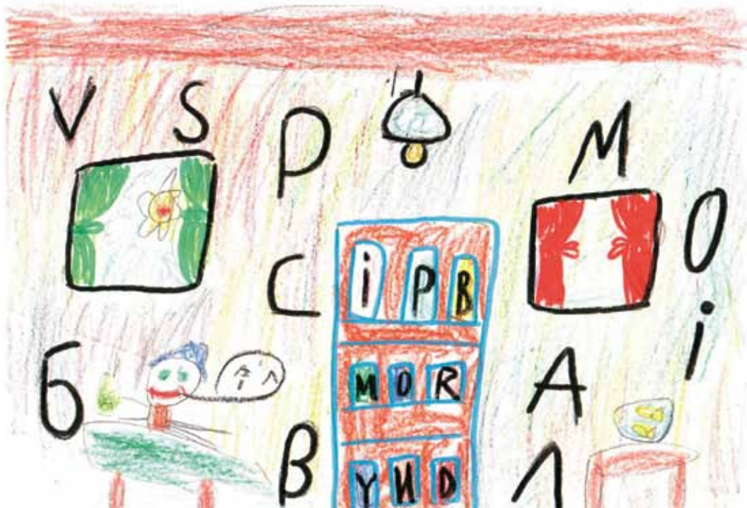
Калоян Димитров, 6 години ЦДГ 25 "Братя Грим", Шумен