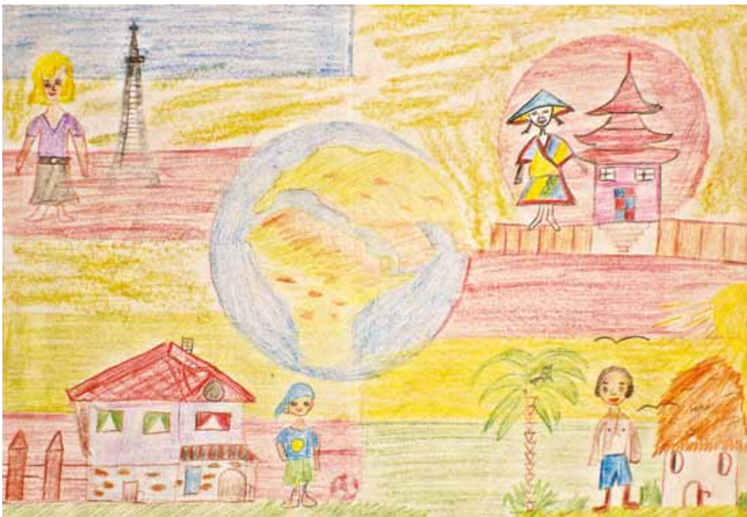
Преслава Пламенова, 7 години ЦДГ No 2 "Юнско въстание", гр. Плевен